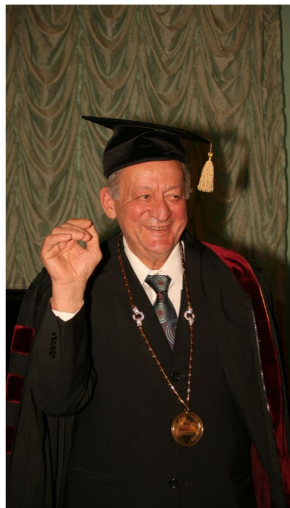
Информационно-аналитический журнал «Химический Эксперт»