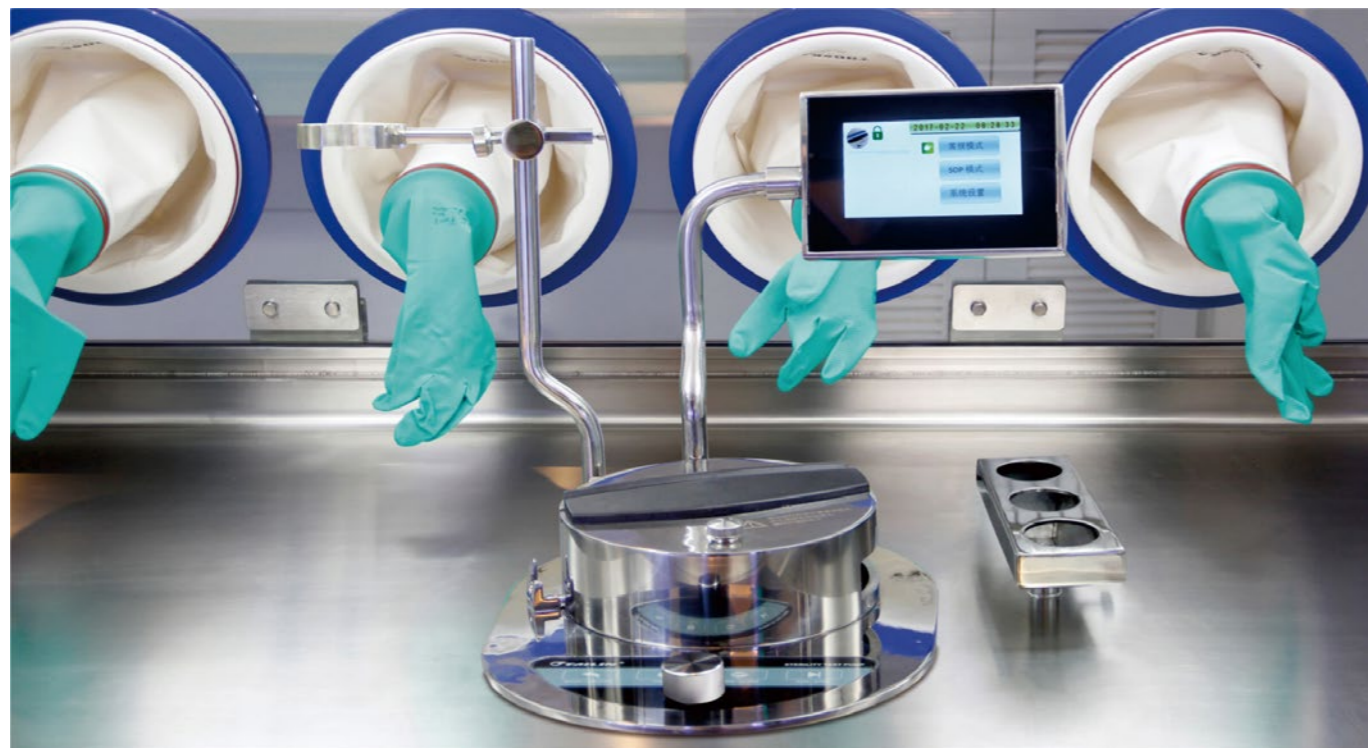
Изолятор со встроенной системой стерильности