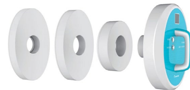
Тестер целостности перчаток GIT-WLAN02

Компания РЕАТОРГ осуществляет проектирование и комплексное оснащение химико-фармацевтических производств и лабораторий: оборудование, технологические трубопроводы, приборы, расходные материалы, мебель, посуда, реактивы.