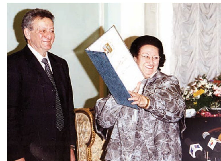
Почетный доктор РХТУ им.Д.И.Менделеева Монтсеррат Кабалье