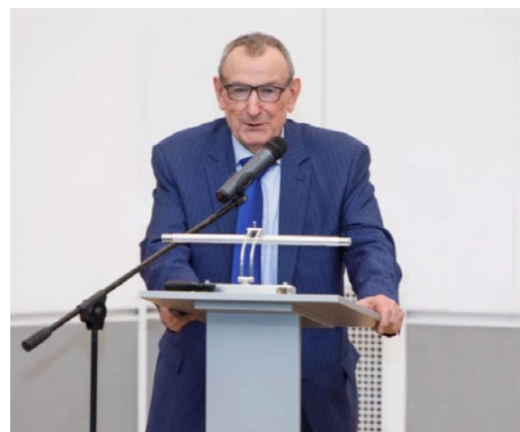
Информационно-аналитический журнал «Химический Эксперт»

С недавнего времени к числу приоритетов добавился конкурс молодых учёных «Умные СИЗОД» – конкурс научных работ студентов, аспирантов, молодых учёных и специалистов в области средств индивидуальной защиты органов дыхания, направленный на стимулирование творческой деятельности молодёжи, ускорение трансфера инновационных идей и разработок в производство.