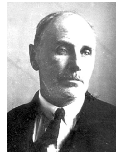
Профессор Марк Петрович Дукельский

В далёкие 1920–1930-е годы в нашей стране приступили к производству новых для отечественного машиностроения видов машин и аппаратов (в том числе химической аппаратуры). Тогда же началось оформление объединения родственных предприятий, создание первых в стране научных центров, специализирующихся на задачах химического машиностроения. В декабре 1927 г. в системе ВСНХ (Высший Совет Народного Хозяйства) было сформировано государственное химико-аппаратурное товарищество «Химстрой», которое заложило «первый камень» в организацию в нашей стране отрасли химического машиностроения.