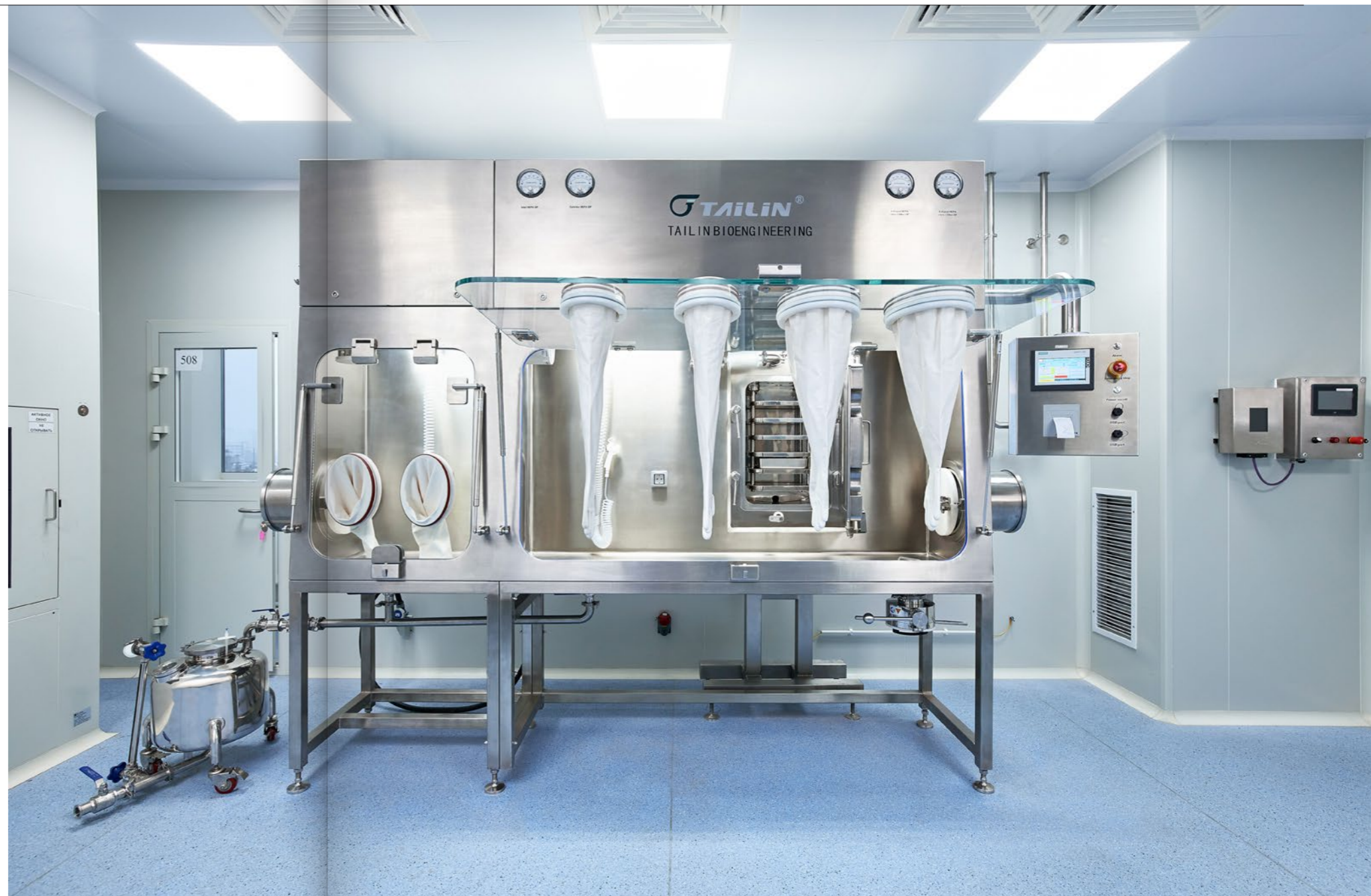
Изолятор с отрицательным давлением