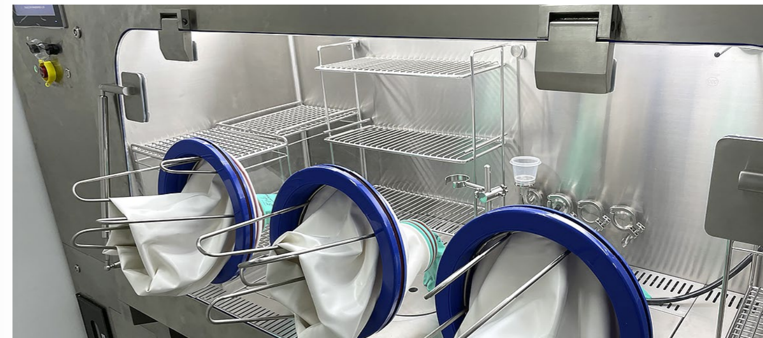
Изолятор со встроенной системой стерильности

Помимо изоляторов для работы с препаратами, требующими поддержания асептических условий, компания Tailin разрабатывает и производит изоляторы для высокотоксичных производств. Изолятор серии NPA предназначен для смешивания, дозирования, отбора проб высокотоксичных и сенситизирующих препаратов. Такой изолятор работает при отрицательном давлении, обеспечивая защиту оператора от вредного воздействия сильнодействующих веществ. Высокая герметичность изолятора позволяет работать с материалами, диапазон профессионального воздействия (ОЕВ) которых равен 5. Герметичность камеры соответствует стандарту ISO10648-2.