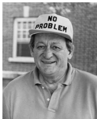
На семинаре Американского химического общества. США, Сиракузский университет

образования, выбору эффективных путей его совершенствования. Пройдя в начале жизненного пути хорошую инженерную практику на промышленном предприятии, он твёрдо усвоил и следовал в своей научно-педагогической деятельности канонической заповеди – наука и образование всегда должны быть направлены на запросы производства как в развитии производительных сил, так и в обеспечении его высококвалифицированными инженерными кадрами.